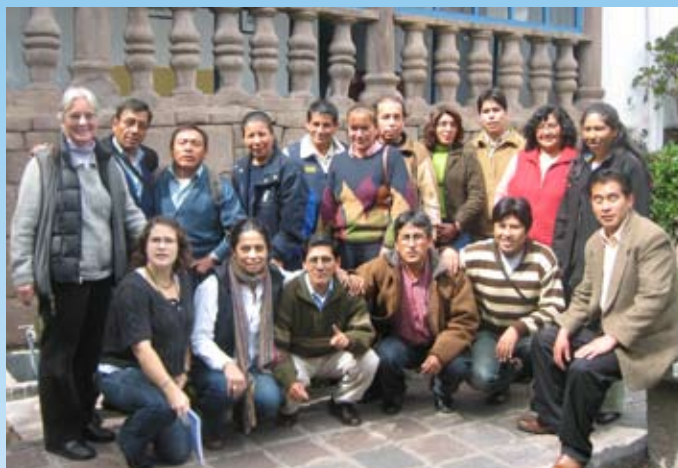
Participantes en el seminario binacional de fortalecimiento institucional realizado en la ciudad de Cusco, Perú, noviembre 2008

Central Única Macro Regional de Rondas Campesinas de Sur del Perú (CUMARC) -que agrupa a ronderos de Cusco, Puno, Apurímac y Arequipa-, y el Centro de Orientación en Sistemas de Justicia Originaria (COSIJO), de Cochabamba, Bolivia. El seminario se enfocó en cinco temas: el trabajo en redes, las relaciones con las autoridades y con los medios de comunicación, el trabajo con aliados nacionales e internacionales, el uso de las leyes de acceso a la información para la defensa y promoción de los derechos humanos, el uso de instrumentos y mecanismos internacionales de protección de derechos humanos, como los ofrecidos por el sistema interamericano de derechos humanos, y finalmente, temas relacionados