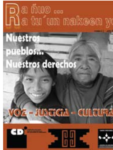
Cubierta de una de las más recientes revistas producidas por el Centro

El café es el color de la madre tierra, fuente material y espiritual de la vida e identidad de las culturas indígenas; las dos caras en amarillo personifican a las autoridades que mandan obedeciendo, portando la voz de la asamblea; los cuatro caracoles en su conjunto representan los puntos cardinales, a su vez son el lenguaje y comunicación intercultural entre los seres humanos, y su cos-